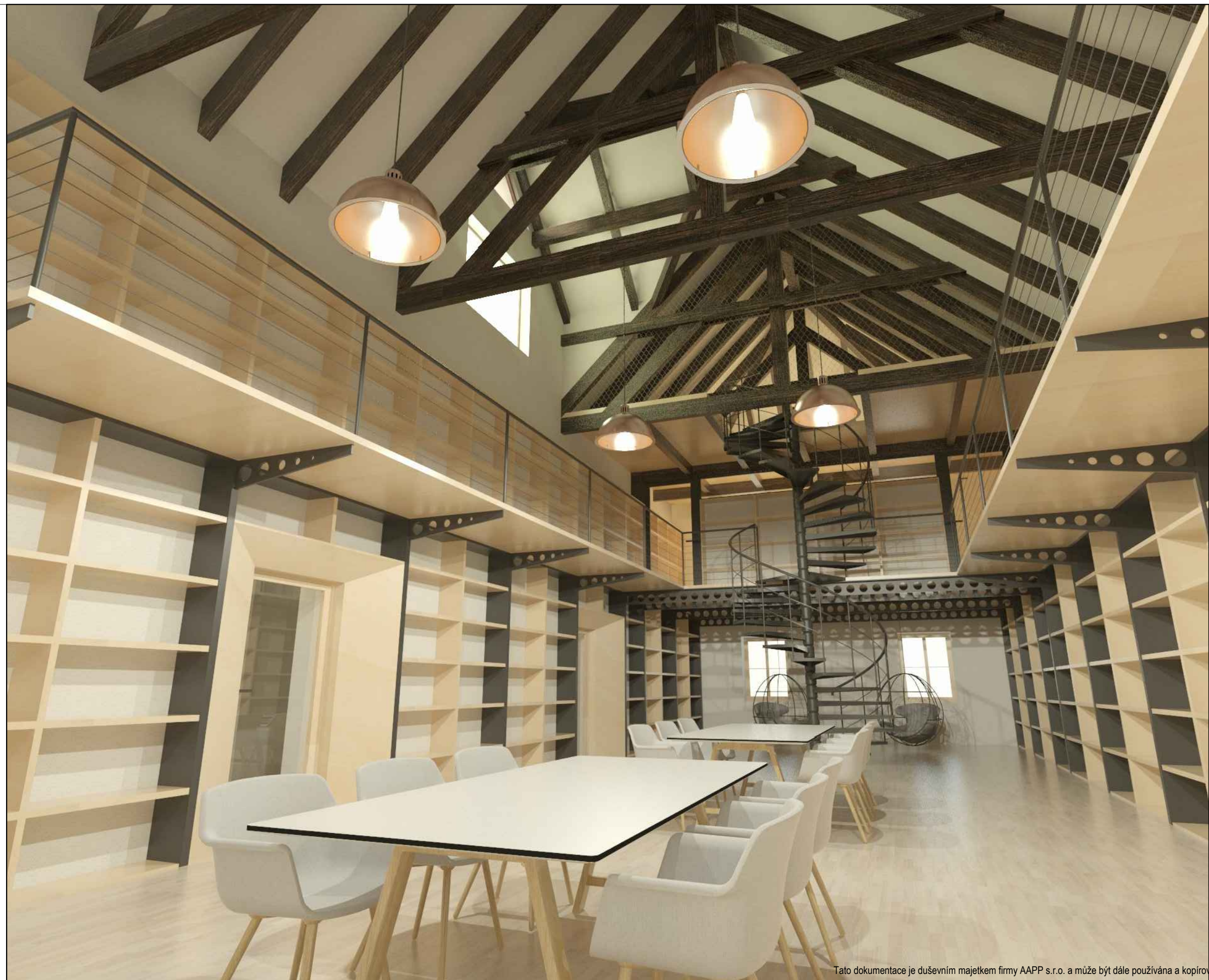
Tato dokumentace je duševním majetkem firmy AAPP s.r.o. a může být dále používána a kopírována pouze s písemným souhlasem majitele.