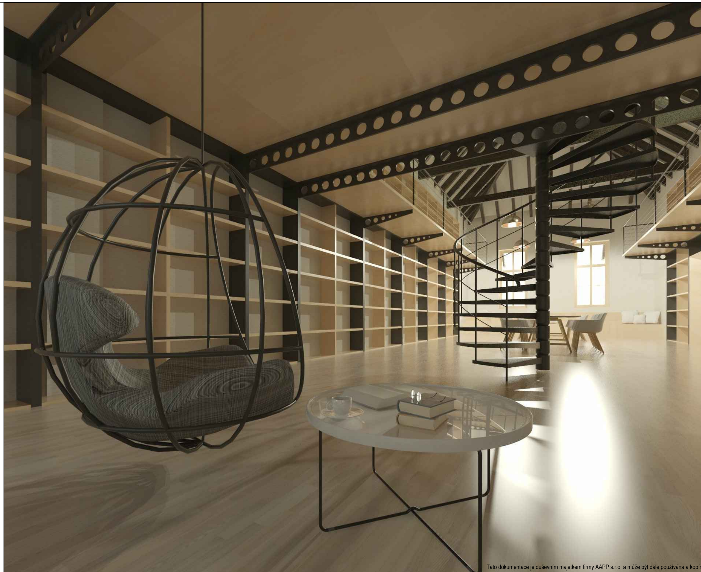
Tato dokumentace je duševním majetkem firmy AAPP s.r.o. a může být dále používána a kopírována pouze s písemným souhlasem majitele.