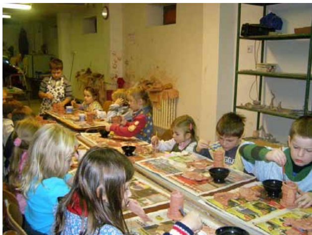
děti z mateřské školky