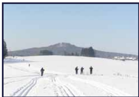
Blížíme se ke Kumburku