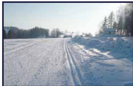
Stopa upravená rolbou