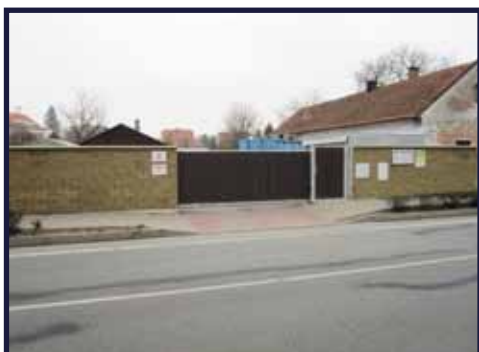
Rekonstrukce obecního dvora