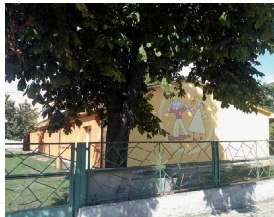
Opravená mateřská škola.

Obec byla rovněž úspěšná se žádostí o dotaci na pořízení multifunkčního stroje na údržbu ulic a veřejných pro-