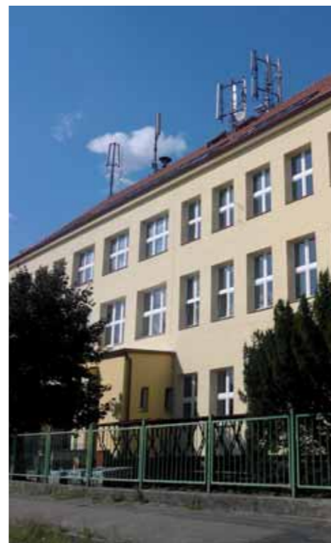
Také škola se dočkala rekonstrukce.

V dubnu 2014 podal Mgr. Václav Kobera rezignaci na svou funkci ředitele základní školy ve Velkém Oseku.