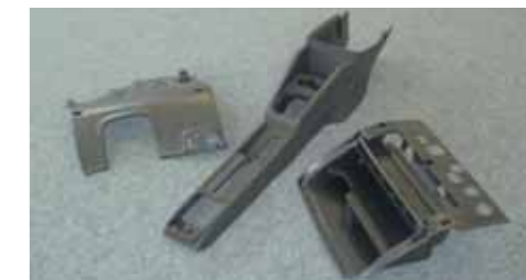
Výrobky: Obložení pod volant, středová konzole a příhrádka