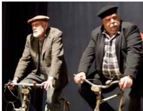
Fotky jsou z francouzské komedie Zelňačka, kterou uvádí DS Vojan Libice nad Cidlinou.

Dále na sobotu 8. listopadu od 18 hodin připravil DS Vojan Libice nad Cidlinou reprízu francouzské komedie Zelňačka. Komédie pojednává o dvou starých sousedech, kteří žijí na samotě a užívají si zaslouženého odpočinku. Svě dny oba dědci tráví pěstováním hlávkového zelí, sekáním dřeva, vařením zelňačky a hlavně popíjením dobrého vína. Do jejich pohody a vzpomínek však shodou okolností vstoupí mimozemšťan z planety Oxo. „Jak všechno dopadne? Přijďte se podívat! Všichni se ale můžete těšit na příběh, ze kterého dýchá atmosféra spokojenosti, moudrosti a svěží životní filosofie,“ pozval režisér Jiří Hlávka.