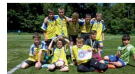
Družstvo 4.-5. třída, 2. místo.