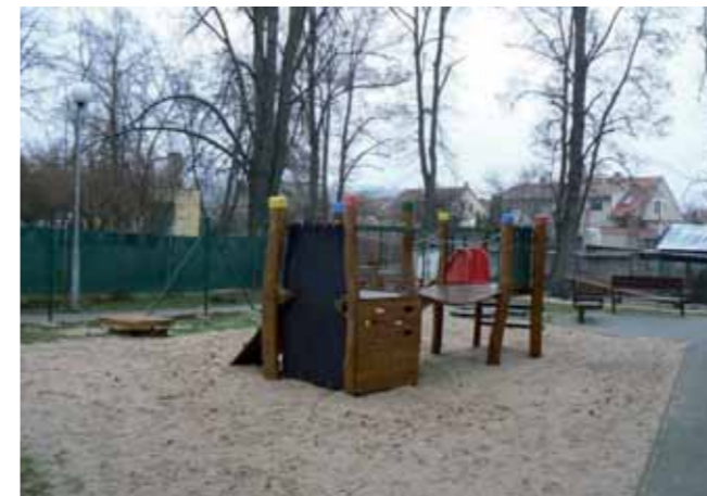
Dětské hřiště u Dělnického domu

Pokusíme se zajistit zdroje na stavební úpravy domu s pečovatelskou službou na moderní a zejména starším spoluobčanům vyhovující zařízení.