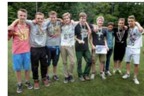
Vítězné družstvo 8.-9. tříd.

6. místo družstvo 1.-3. tř. (Novák, Kučař, Richter, Kalaš, Meloun, Koška, Czako, Průcha, Vaníček, Kruliš, Eger)