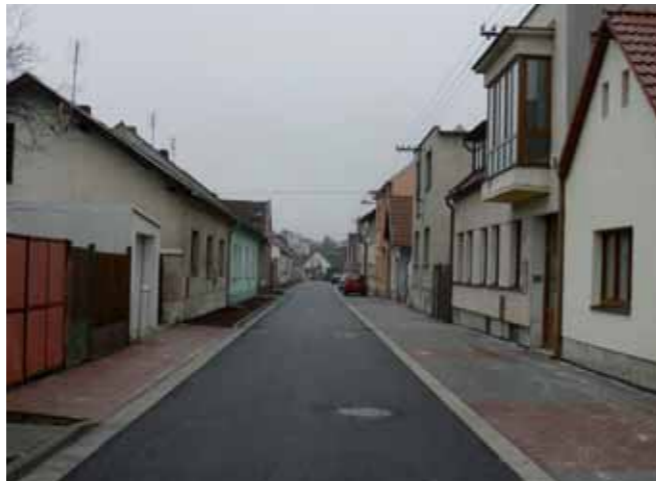
Zrekonstruovaná ulice Havlíčkova

Fungující infrastruktura je základ každé obce, a proto její zlepšování bylo, je a bude naší prioritou. Podařilo se nám v roce 2014 získat dotaci na II. etapu (dostavbu) kanalizace za 81,5 mil. Kč, zajistili jsme rekonstrukci ulice Havlíčkova za 3,25 mil. Kč a vybudovali jsme několik dětských hřišť za více než 1,4 mil. Kč s příspěvím dotací. Podařilo se nám v tomto roce provést s dotací výměnu oken a zateplení budov základní a mateřské školy za více než 15,5 mil. Kč.