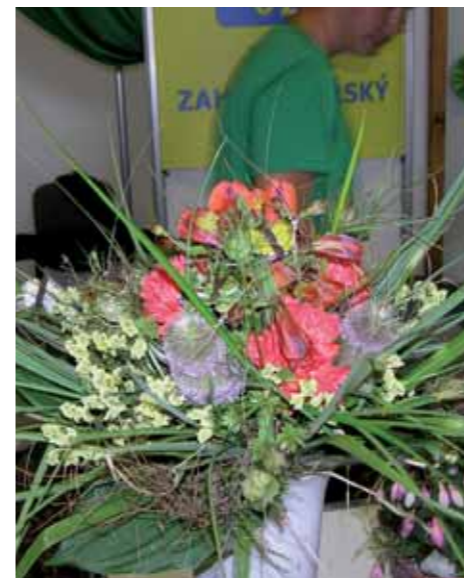
Markova kytice