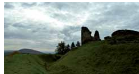
Na Lichnici

Při východu z města procházíme místem připraveným pro stavbu kostela z návrhu arch. Davida Vávry, jelikož ani kostel v tomto průmyslovém městečku nikdy postaven nebyl. Při stoupání nad město můžeme svoji výšku porovnávat s nedalekými panelovými domy. Cesta je docela příkrá, ale jen kilometr dlouhá. Pod hradem Lichnice se vydýcháváme v zajímavém hostinci jménem Posilovna, kde se dokonce vaří. Ze zříceniny jsou krásné rozhledy na Polabí a Čáslavskou kotlinu.