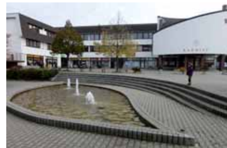
Náměstí v Třemošnici

vadesátých let. Na druhou stranu se zde podařilo na náměstí koncentrovat všechny potřebné služby. Atmosféru prostoru zpřiměňuje kašna s lavičkami a nechybí ani cukrárna, jejíž nabídky k posezení využíváme. Průmyslové město o 3100 obyvatelích toho kromě náměstí příliš nenabízí.