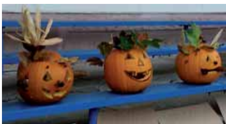
Takových fešáků bylo k vidění mnohem více!