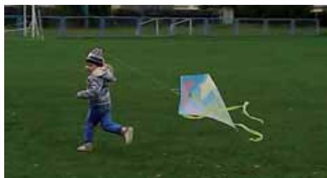
Někdy se větru prostě musí pomáhat!