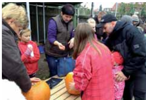
Malí, velcí – prostě partáci!