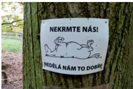
Upozornění u Žlebských Chvalovic

místo rozhledny pouhý vysílač. Trasu si zpestřujeme sběrem a následným využitím ošklivých plastových fáborek k zabavení dětí na delší trase. Pod Krkankou následuje prudké klesání až na okraj Žlebských Chvalovic. Na rozcestí potkáváme několik koní, které je výslovně zakázáno krmit.