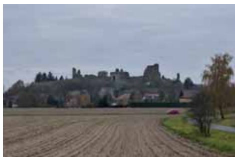
Zřícenina hradu Lichnice

některé hrady, aby nesloužily jako úkryt při vpádu nepřítele, a to se dotklo i Lichnice. Tím začal pozvolný úpadek hradu až ve zřícenině. K hradu se váže celá řada tajemných pověstí. Na postupné obnově a údržbě se v posledních letech podílejí různá občanská sdružení a jako majitel město Třemošnice. Místo je příjemné svými výhledy do krajiny pod Železnými horami a konají se zde v létě četné kulturní akce.