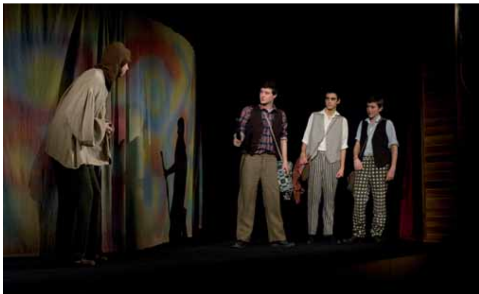
Fotka z pohádky Neohrožený Mikeš v provedení DS Vojan Libice nad Cidlinou.