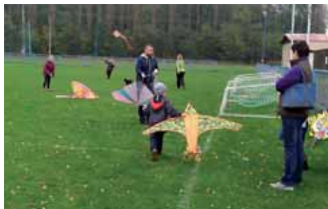
Drak je postaven a jde se na to!