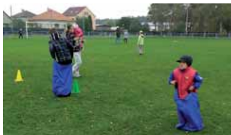
Moc prima bylo i sportování!