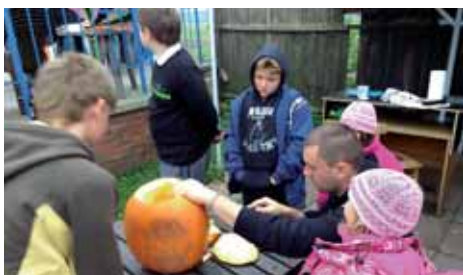
Vyřezat to musí dospělák, ale přísný pohled dětí nechybí!