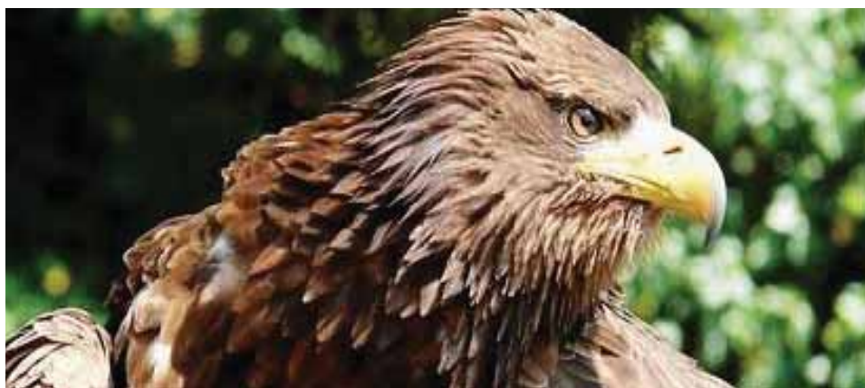
Samec a samice se navzájem liší pouze velikostí

Orel mořský ( Haliaeetus albicilla ) je velký druh dravce z čeledi jestřábovitých, patřící k největším žijícím orlům vůbec. Žije v blízkosti vod na rozsáhlém území Evropy a Asie a živí se převážně rybami a ptáky. V minulosti z mnoha oblastí Evropy zvláště v důsledku lidského pronásledování zcela vymizel, od 80. let 20. století však začala jeho početnost opět stoupat a postupně obsadil řadu původních hnízdišť.