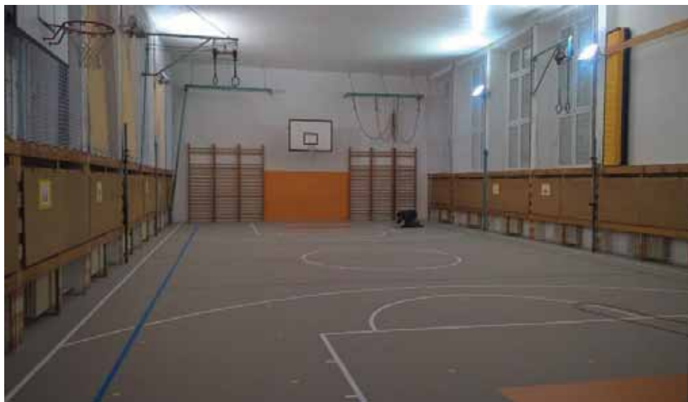
Zrekonstruovaná podlaha ve školní tělocvičně

na tom, že je třeba oproti I. etapě kanalizace v letech 2002 – 2005 zajistit, aby se všichni majitelé napojovaných nemovitostí v 2. etapě kanalizace podíleli na úhradě nákladů za připojení na kanalizaci, a tím se zabrání nerovnosti v přístupu ke stejné službě. Dále zastupitelstvo schválilo inventarizaci majetku obce za rok 2015, vyřazeno bylo 26 položek starého a nepoužitelného majetku v celkové účetní (nikoliv reálné) hodnotě cca 130 tis. Kč. Dále projednávalo záměr společnosti GEOSAN ohledně přípravy parcelizace pozemku č. 600/2 pro cca 130 rodinných domů směrem na Volárnu viz obrázky níže, bližší informace lze nalézt na webu obce www.velky-osek.cz v pravém sloupci. Součástí jednání byla rovněž prezentace s podrobnostmi o jednotlivých projektech a záměrech, mj. rekonstrukce Dělnického domu, k níž je rovněž vyvěšena studie na webu obce.