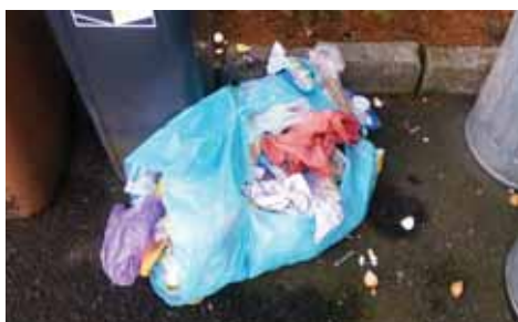
Odpad odložený neznámým původcem

Objemný odpad má občan možnost odevzdat během roku v obecním dvoře, rovněž tak pneumatiky a vysloužilé velké elektroprístroje.