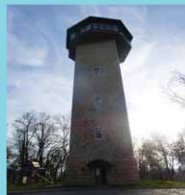
Rozhledna Havířská bouda

tím, že je postavena z neomítnutého opracovaného kamene, tzv. kyklopského zdiva. Další zvláštností je výtah na vrchol (bezbariérová rozhledna) a hlavně je na vrcholu bar s prosklenou vyhlídkou. Výška rozhledny je zhruba 30 metrů a vede na ni 160 schodů.