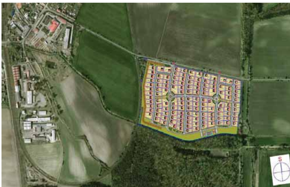
Studie zastavěnosti spol. GEOSAN na pozemku č. 600/2 směrem na Volárnu

Na únorovém (23. 2. 2016) zasedání zastupitelstvo zejména schvalovalo účelový příspěvek ve výši 25 tis. Kč na kanalizaci pro případ, že by někteří majitelé napojovaných nemovitostí nechtěli obci poskytnout ekologický dar. Pokud tento příspěvek bude obci poskytnut, tak celá jeho výše musí být dle podmínek poskytovatele dotace (SFŽP) odpočtena z poskytnuté dotace. Nicméně výrazná většina zastupitelstva (12 z 15 členů) se shodla