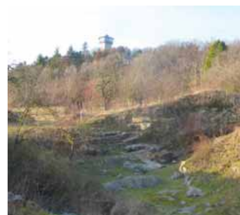
Křídový lom s vrchem Kaňk v pozadí

Sestupujeme dále dolů do Kutné Hory - Sedlece, kde se u kostnice houfují turisté. Kostnice je sice zajímavá atrakce, ale pamatuji se zde exkurzi ze základní školy a pro děti to moc není. V podstatě stačí prohlédnout pár obrázků u vchodu, nakouknout dovnitř a děti mají jasno, že nejdeme dovnitř. Je zde i několik restaurací a cukrárna. Cukrárně neodoláme a dáváme si zmrzlinu, ačkoliv by měla být vlastně zima. Na nádraží je to kousek po hlavní silnici okolo výrobního závodu na cigarety Philip Morris. Na kutnohorském nádraží je infocentrum pro turisty, jinak zde není nic k vidění. Namačkáme se spolu se zmatenými japonskými turisty do vlaku a míříme směr domov.