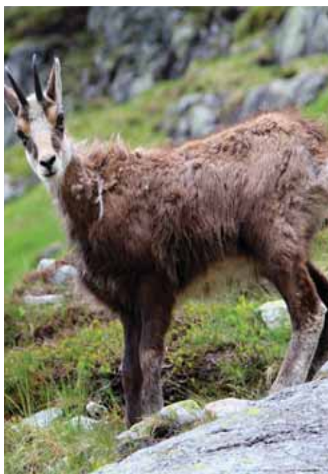
Kamzík horský (Rupicapra rupicapra)