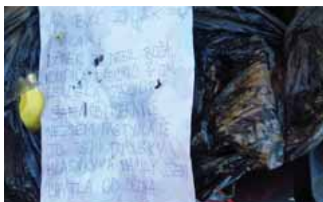
Odpad odložený do popelnice „sousedem“, který si popelnici zamyká a občas zapomene klíč.

Poslední dobou se množí případy, že neukáznění občané odloží odpady ne do sběrné nádoby - popelnice, ale někde na místě, které je v blízkosti komunikace, v blízkosti místa s popelnici