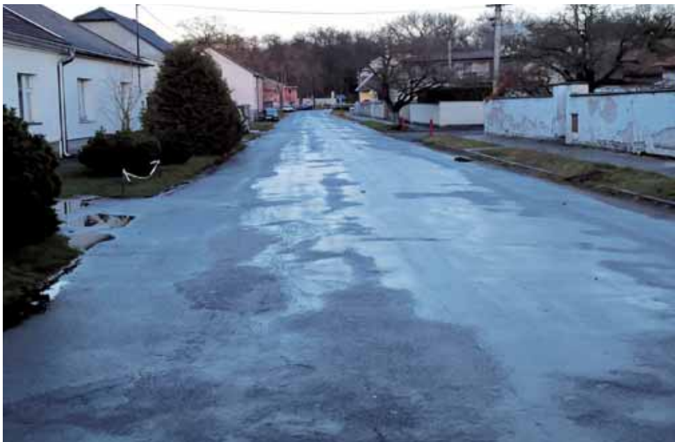
Současný stav ulice Palackého

V listopadu byl dokončen projekt obnovy zeleně v ulici Za Drahou ve čtvrti Na Šanghaji, kde byly v širokém zeleném pásu vysázeny nové plodnosné stromy (švestky, hrušky, třešně) a několik nových lip na kolonádě u Bačovky pod mateřskou školou. Na jaře již byly provedeny arboristické výškové ořezy v lípách na kolonádě podél Bačovky. Náklad projektu byl cca 170 tis. Kč, přičemž dotace byla 80 %, tj. cca 133 tis. Kč. Do budoucna má obec v úmyslu připravovat další projekty na obnovu a výsadbu nové zeleně nejen v zástavbě obce, ale i v okolí kolem obce, např. při cestě na zdymadlo, od vodního zdroje směrem k Veltrubům, podél cesty k obecnímu lesu od silnice na Volárnu.