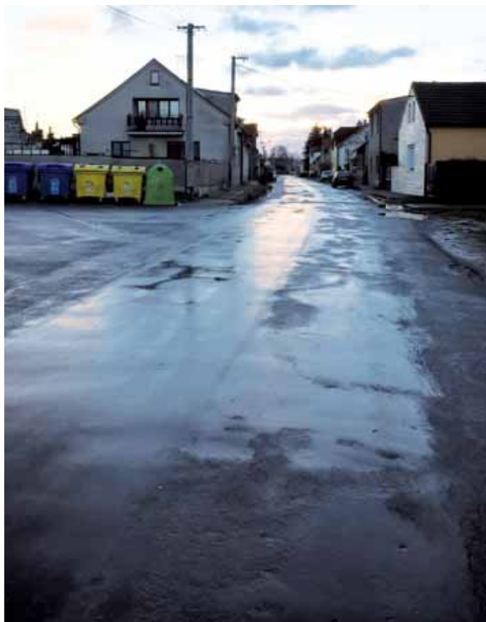
Současný stav ulice Palackého