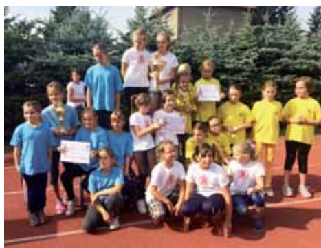
3. místo mladších zákyň