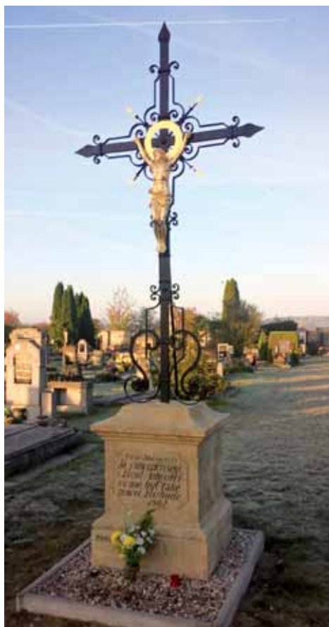
Zrekonstruovaný kříž na obecním hřbitově

V listopadu rada vybrala dodavatele energeticky úsporných opatření společnost MVV Energie, který zrealizuje v roce 2017 za cca 9 mil. Kč osazení nových plynových kotlen v základní a mateřské škole včetně regulace teploty v jednotlivých místnostech a nová LED svítidla v celé obci. Tato investice se bude splácet z uspořené nákladů za energie, kdy ze stávajících ročních nákladů na energie cca 1,6 mil. Kč se od roku 2018 uspoří ročně cca 50 %.