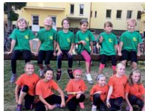
Naše nejmladší hráčky

V kategorii starších zákyň se nejlepším družstvem stalo družstvo děvčat ze Sokolče. Tato děvčata neprohrála žádný