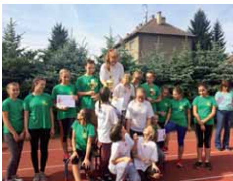
2. a 3. místo starších zákyň