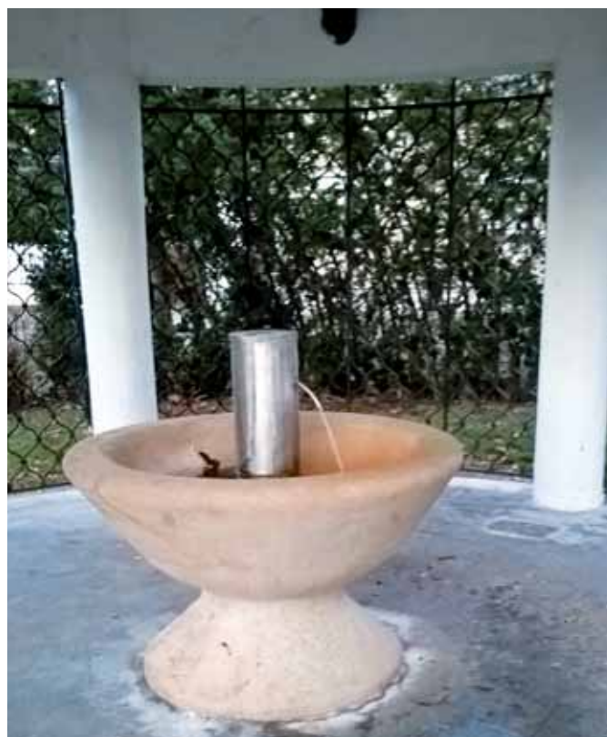
Opravená fontána minerálního pramene

Dále rada dohlížela na přípravu projektu „Rekonstrukce Dělnického domu“, stavebně technický průzkum prokázal, že je vhodné zadní přístavky a kuchyň zbourat a postavit znovu, jelikož jde o „přilepené přístavky“ na původní objekt Dělnického domu, zdvo v těchto částech je vlhké a není známa jeho skladba, což je i racionální, protože do zadní části má být přestěhována obecní knihovna. Návrh projektové dokumentace má vzniknout v prvním čtvrtletí roku 2017 včetně vizualizace.