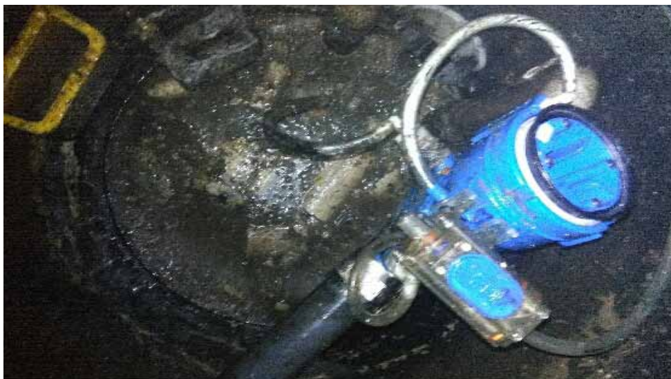
Tuky se v jímkce usadí, posléze odloupnou jako na obrázku