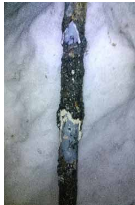
Senzorka obalená tuky

Dále bych chtěl poděkovat všem, kteří chápou nebo pochopili, že kanalizace je nás všech a pokud nefunguje sousedovi, tak je to i můj problém. Věřím a trochu i doufám, že kanalizace nebude tím, co nás rozděluje, ale tím co nás spojuje.