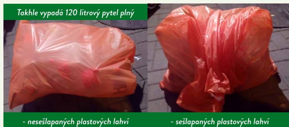
Takhle vypadá 120 litrový pytel plný