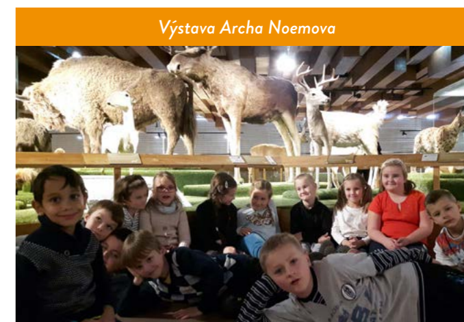
Výstava Archa Noemova