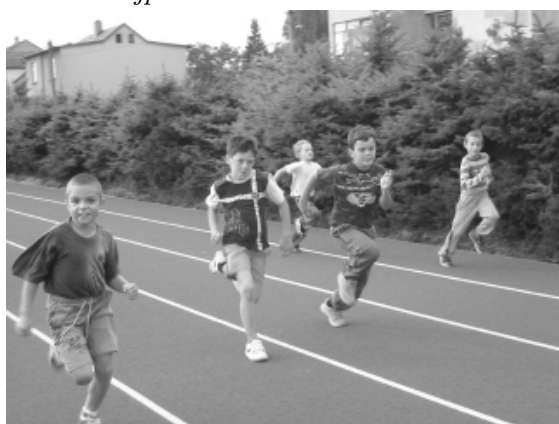
4. A už můžeme závodit