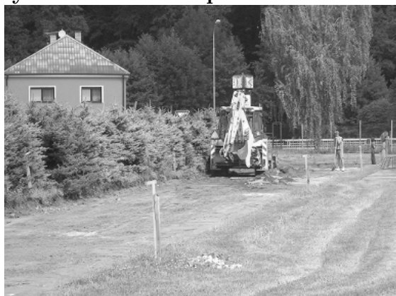
1. Nejprve odstranit starou škváru