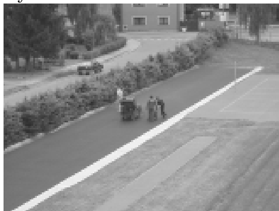
3. Po mnoha dalších úkonech už jen nabarvit