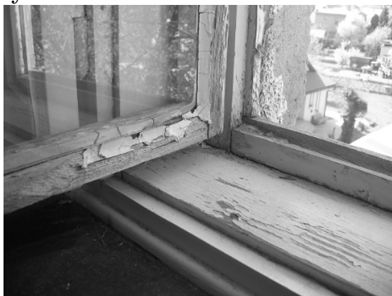
1. Okna už výměnu opravdu potřebovala