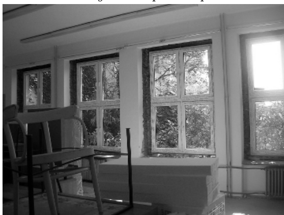
4. Třída s novými okny