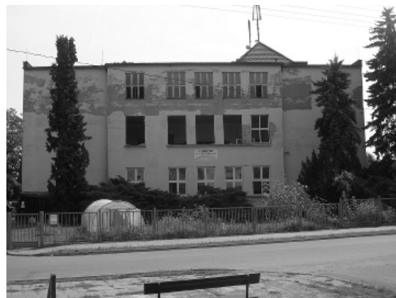
3. Uprostřed práce uprostřed západní stěny budovy