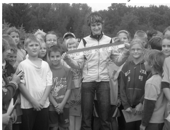
5. A dokončení nové dráhy oslavit

jihocheské pověsti O kolozubém kostlivci z Chýnova. Znalost pověsti se nám hodila v noci, když jsme byli probuzeni. Museli jsme se teple obléknout, každý dostal do ruky papírovou růži (podle pověsti) a musel jít podle světýlek až ke křížku, kde se podepsal a svou růží zanechal. Stezka byla dlouhá a strašidelná i krásná, protože svítil úplněk. Na poli jsme v měsíční záři viděli pasoucí se siluety krav a měsícem ozářené dubové listy proti obloze vypadaly úžasně.