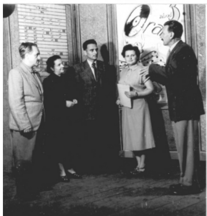
“Svátek pana ředitele”