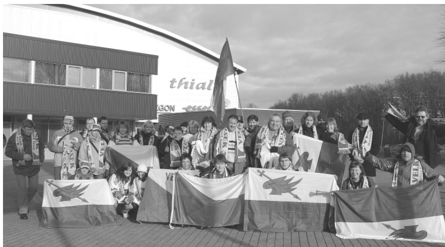
Účastníci zájezdu do Heerenveen