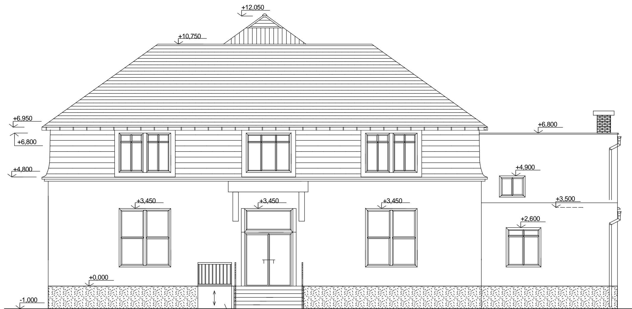
POHLED VÝCHODNÍ varianta B